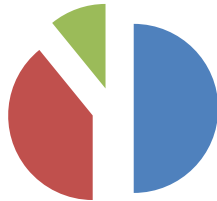
نسبة السجناء متوسطي الدخل ومنخفضي الدخل رجال